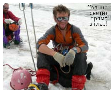
Солнце светит прямо в глаз!