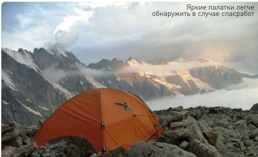
Яркие палатки легче обнаружить в случае спсработ