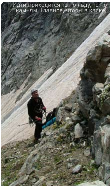
Идти приходится то по льду, то по камням. Главное, чтобы в каске!