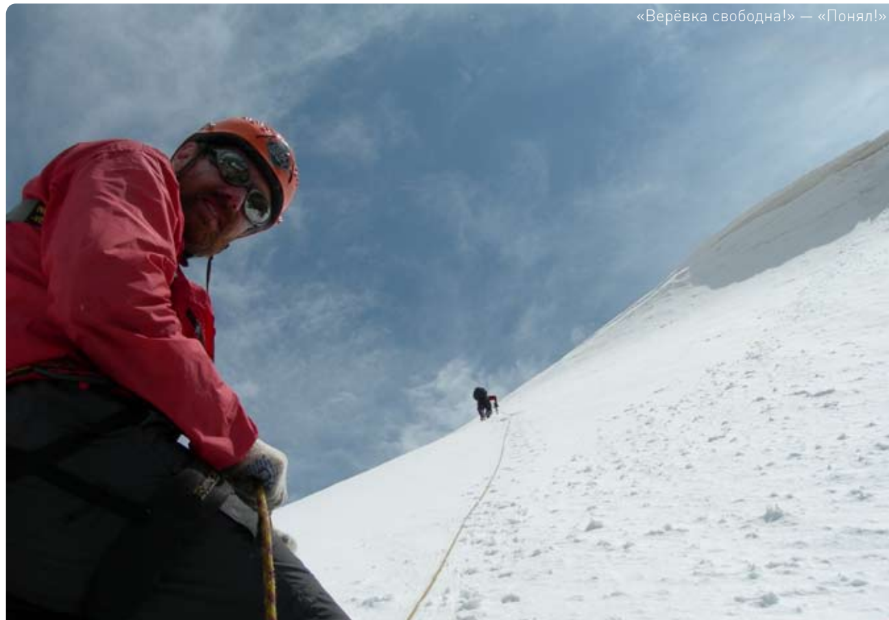
«Верёвка свободна!» — «Понял!»

То ли из-за непостоянства погоды, то ли за суровый вид гору Ушбу называют «ведьмой». Два скальных рога, покрытых снегом, круто задирающих пики в небо, далеко видны над хребтами Кавказа. Её высота — 4 690 метров, подъём из лагеря и спуск до палаток занимает не менее 10 часов, а к самой вершине ведёт «нож» — острый гребень из снега и льда. Шёл пятый день похода, и мы идём на Ушбу после того, как два дня просидели в палатках из-за низкой облачности и густого тумана. Снег достаточно плотный, поэтому в трещины мы не проваливаемся, но ноги всё же вязнут, и «кошки» (металлические платформы с шипами, которые надевают, чтобы не скользить по льду) цепляются за верёвки, которыми мы связаны по двое.