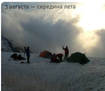
3 августа — середина лета