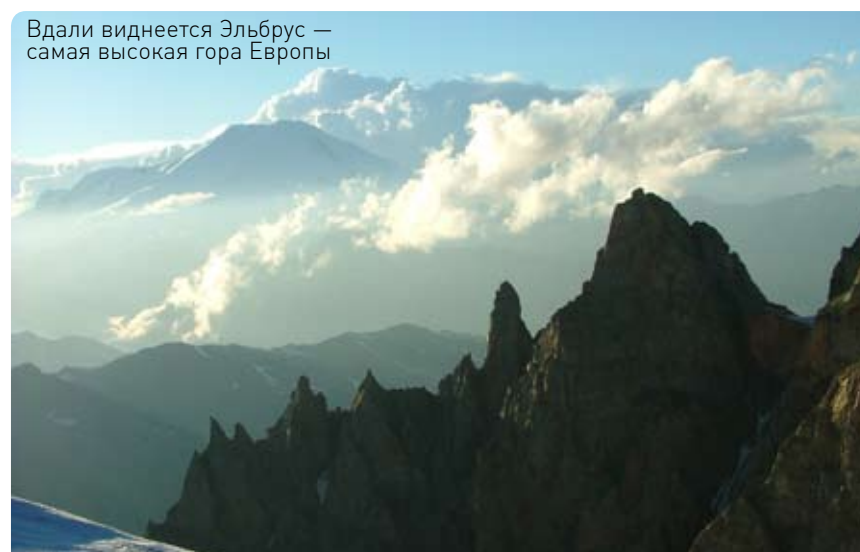
Вдали виднеется Эльбрус — самая высокая гора Европы

ленькое облачко нимбом держалось на его двойной макушке. С перевала так и подзуживало скатиться вниз по ровному гладкому склону, пересечённому несколькими сверху кажущимися пустяковыми трещинами. Если с «Двойного» мы лишь любовались Ушбой, далёкой, захребетной, неприступной и морозно красивой, то на перевале Вуллея стали Ушбу изучать: разглядывали плоские труднопроходимые «зеркала», не для нас предназначенные, удивлялись массивности подпирающих пиков, во все глаза смотрели на «нож», указывающий на саму вершину.