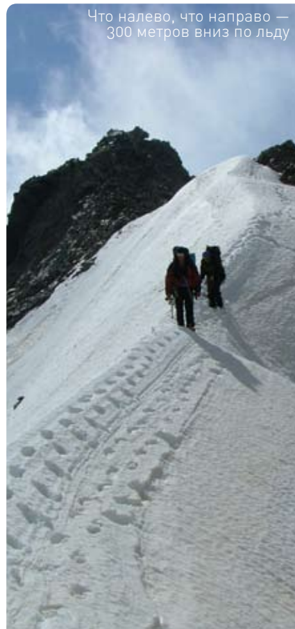
Что налево, что направо — 300 метров вниз по льду

Текст: Женя Бакин