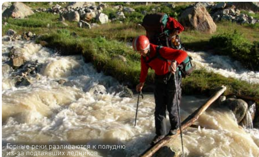
Горные реки разливаются к полудню из-за подтаявших ледников