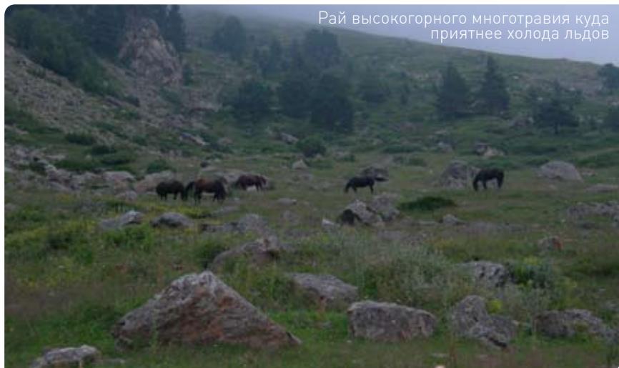
Рай высокогорного многотравия куда приятнее холода льдов