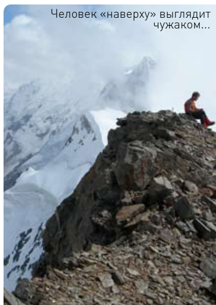
Человек «наверху» выглядит чужаком...