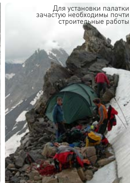
Для установки палатки зачастую необходимы почти строительные работы