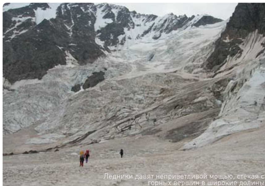
Ледники давят неприветливой мощью, стекая с горных вершин в широкие долины