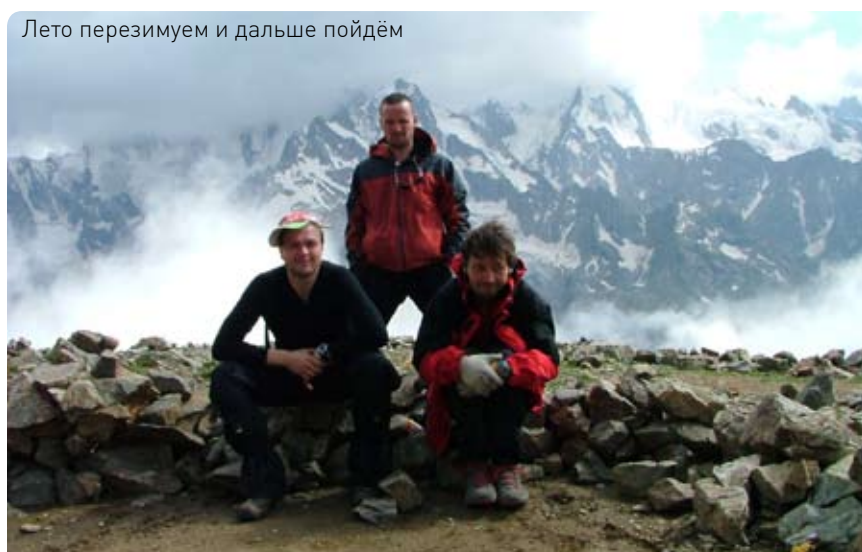
Лето перезимуем и дальше пойдём