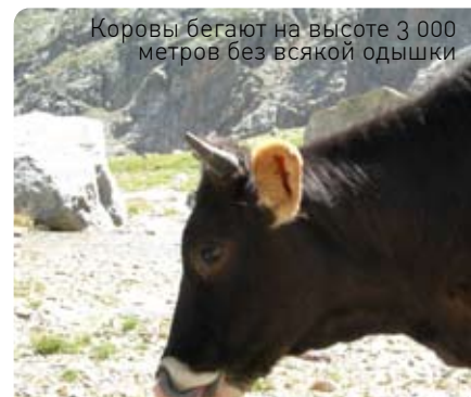
Коровы бегают на высоте 3 000 метров без всякой одышки