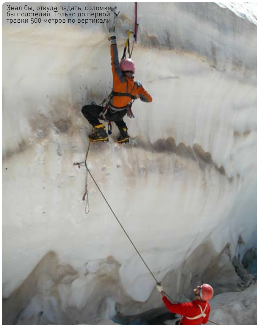
Знал бы, откуда падать, соломки бы подстелил. Только до первой травки 500 метров по вертикали